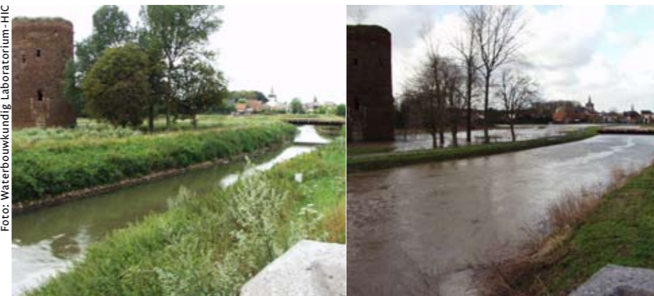
Intelligente regelsystemen die rekening houden met neerslagvoorspellingen kunnen de schade door overstromingen zoals die van de Demer in 2002 beperken.

aanwezige buffercapaciteit beter kan worden benut.